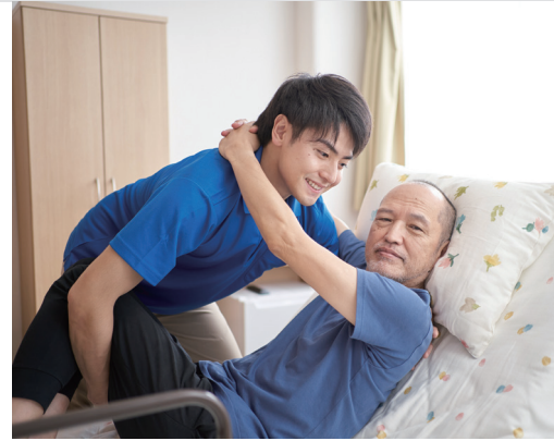
喀痰(かくたん)吸引などのサービスは有資格者、重度訪問介護従業者・看護師・准看護師などが担当します。

対象者は、障害支援区分が区分 1 以上（障害児はこれに相当する支援の度合）である方が、日常生活を送るための介護支援サービスです。常に介護が必要な重い障害がある方でも、在宅での生活が続けられるサービスです。